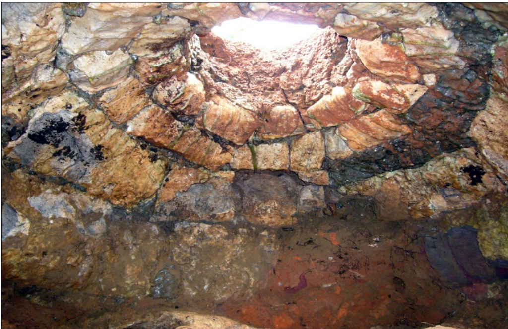
La salle du creuset - Puits initiatique de la Salz - Pyrénées-Orientales

L'oeuvre du mémoire du Master en Géobiologie doit comporter entre 21 et 51 pages.