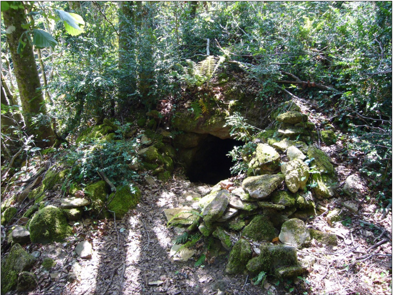
L'entrée dans la salle du creuset - Puits initiatique de la Salz - Pyrénées-Orientales