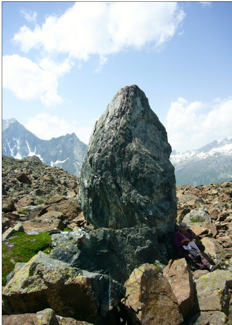
Le menhir du Liapey d'Enfer - Lac du Tsaté - Val d'Hérens.

Effectif limité de 7 à 12 personnes selon les cursus