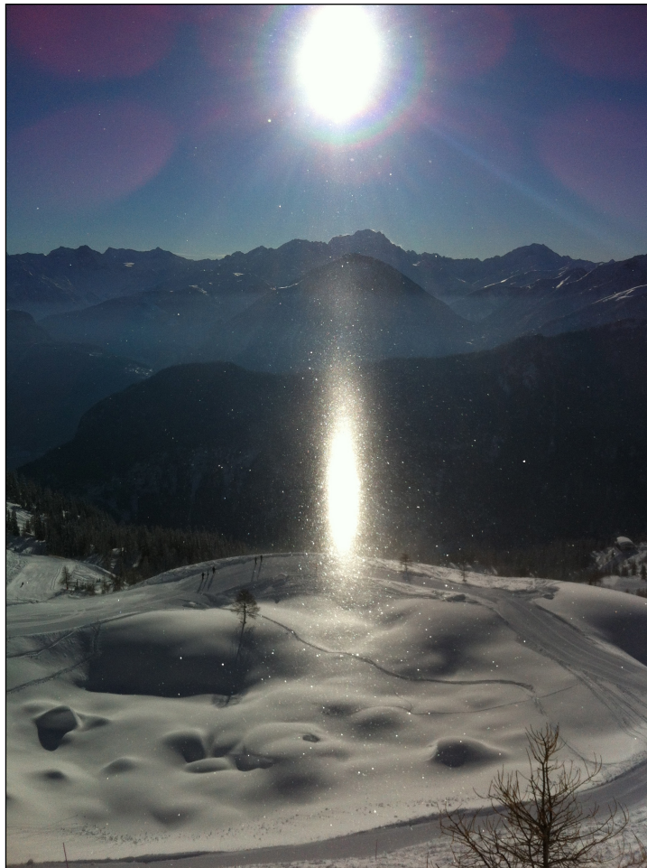
Vortex en concentration lumineuse sur les Alpes valaisannes.

Le vortex de 900'000 unités Bovis du lac du Tsaté est l'un des plus puissants de Suisse. Il permet de rendre l'eau de ce lac imputrescible comme l'eau de sources thérapeutiques telles celle de Lourdes.